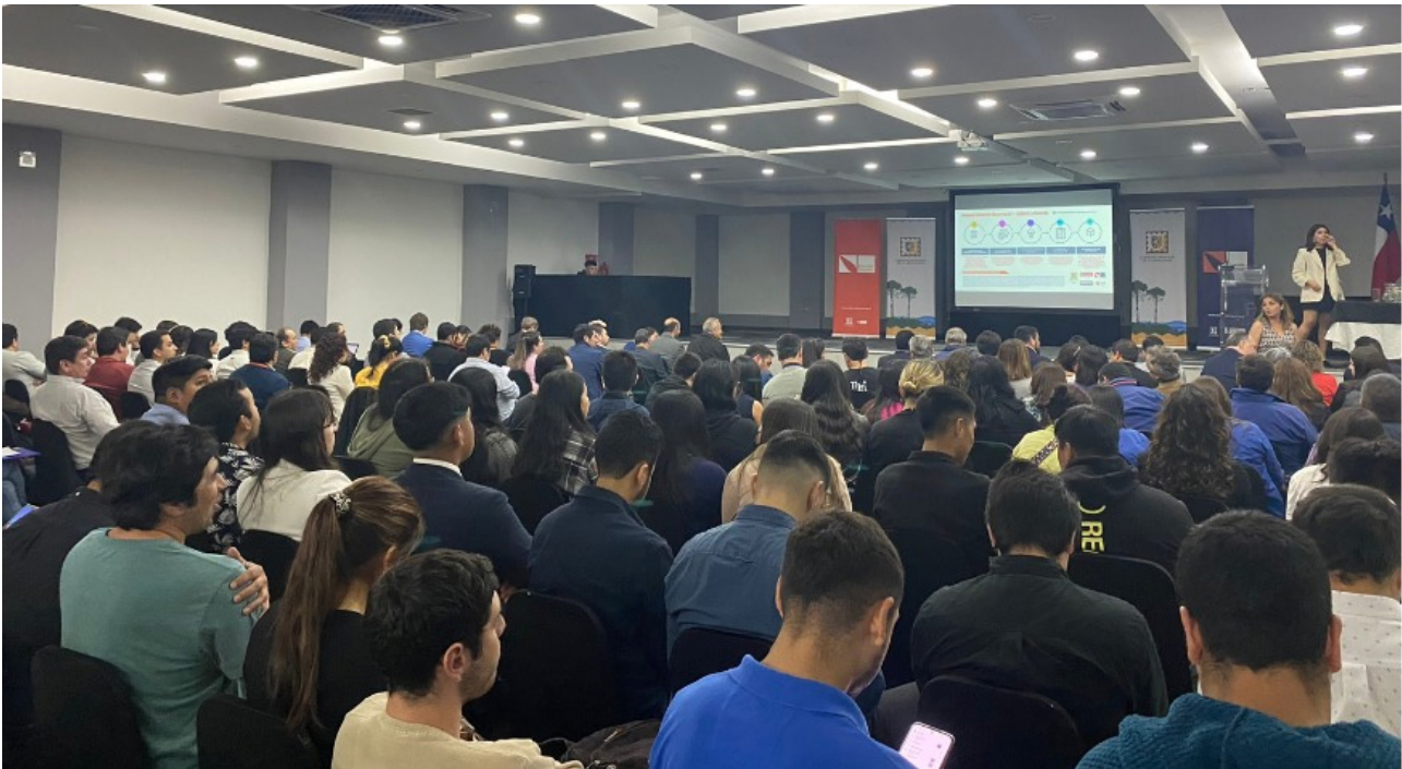
Taller de Innovación Pública, resultados de la aplicación de la metodología SIT, La Araucanía, noviembre de 2022.

Toma tiempo, energía y esfuerzo vital construir colectivamente una estratégica corporativa regional, que amplifique, diversifique y robustece la democracia y la gobernanza para el desarrollo y que permita fomentar e implementar capacidades y modelos de agenciamiento de impacto en la promoción económica regional y la cohesión territorial, al servicio, también, de las colectividades que viven en zonas de rezagos, con pocos habitantes y que trascienden los escenarios tecno-políticos de turno.